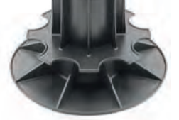
PV14/17 bereik: 140-170 mm