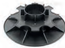
PV8/11 bereik: 80-110 mm