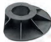
AK5/8 bereik: 50-80 mm