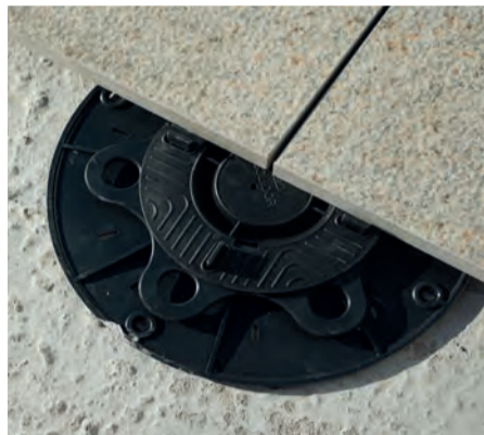
P. 2 Premium