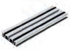
Profiel dikte: 16 mm 2,4 m lang