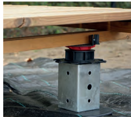
P. 3 Funderingssystemen