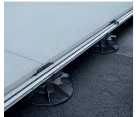
P. 4 Structusol P. 4