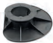
AK3.5/5 bereik: 35-50 mm