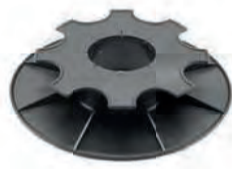
PV3.5/5 bereik: 35-50 mm