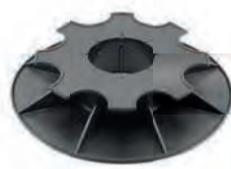
PV5/8 bereik: 50-80 mm