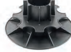
PV11/14 bereik: 110-140 mm