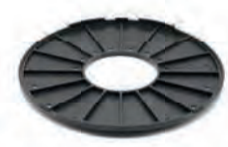
HS2 stapelbaar per 2% kan tot 10%