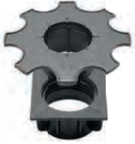
LSR5/8 bereik: 0-35 mm